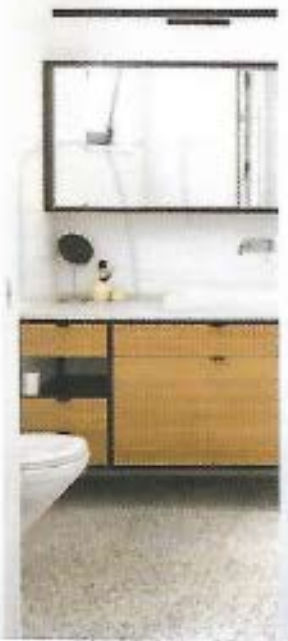
ארון כיור מבמבוק בחדר הרחצה של ההורים. במראה נשקפת השידה בחדרם, שנצבעה בנוון טרקוטה