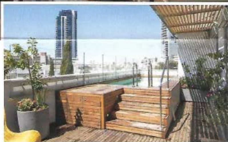
הבריכה מצופה PVC בהיר, שמעניק למים גוון טורקיז עדין. דפנותיה חופ באיפאה. למטה: פינת האוכל מול דלת הכניסה, והמסדרון ליחידת ההורים

מערכת הישיבה בסלון כוללת ספה אפורה, כורסה אדומה, שטיח (שנרכש בחנות "אנתרופולוגי" בניר-יודק) וספת רביצה שתכננו המעצבים עם כריזת ניירות. מערכות הישיבה פונות לכיוון ספרייה, שבחלקה העליון התחתון רלתות הזזה מעץ, ובמרכז מדפי פח ומחיצות רשת שמי תירות חלקית את תכולתה.